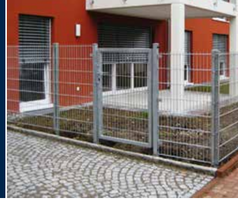
Profilschienenpfahl lt. GUVV