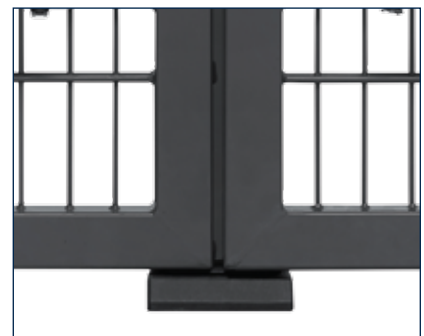
Der passgenaue Auflaufschuh sorgt bei der 2-flügeligen Variante für eine perfekte Schließung.