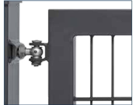
An den Industrie-Toren mit E-Antrieb kommen 16 mm Augenschrauben zum Einsatz. Der Öffnungswinkel beträgt 90°.