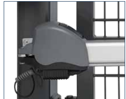
Der Elektroantrieb ist wartungsfrei und stoppt automatisch, wenn sich etwas zwischen den Torflügeln befindet.