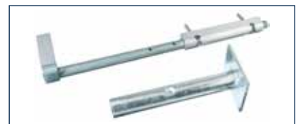
Auch Bodenriegel und -hülse* werden jetzt in Industrie-Qualität geliefert