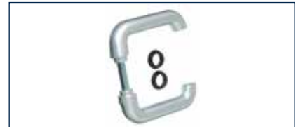
Die neue hochwertige Alu-Drückergarnitur passt optisch perfekt zum Multi-Tor