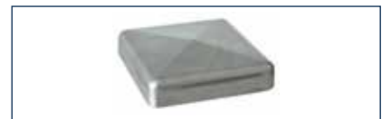
An den Torpfosten kommen jetzt Alu-Kappen zum Einsatz