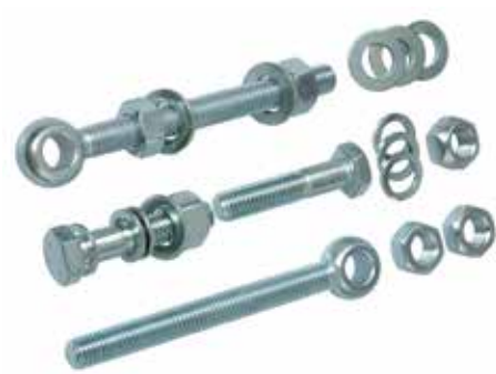
Sehr stabile Torbänder mit Augenschrauben werten das Multi-Tor auf