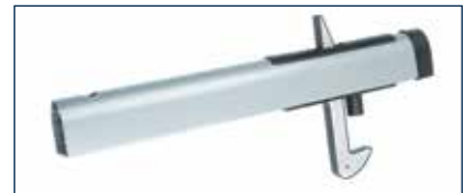
Der Torflügelfeststeller* für das Multi-Tor stammt vom Industrie-Tor