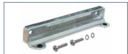
Der passgenaue Anschlag sorgt für höchste Schließgenauigkeit