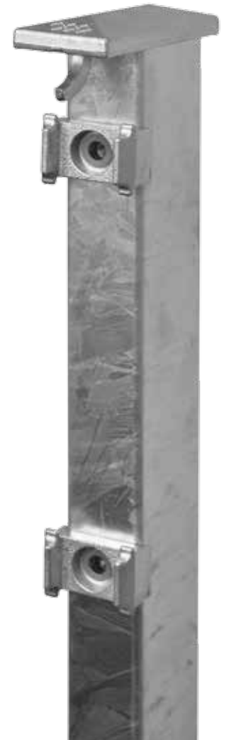
Der Zaunpfahl komplett aus Metall