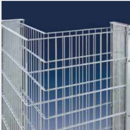
Die Ecklösung im 90° Winkel

Die Tiefe der RANKO® Steinmauer beträgt innen ca. 180 mm. Dieses optimierte Maß sorgt dafür, dass im Vergleich zu herkömmlichen Gabionen deutlich weniger Steine nötig sind – so werden Kosten gespart. Stabilität erhält die Mauer durch die feuerverzinkten Doppelstabmatten vom Typ 8/6/8 sowie durch die Profilrohrpfähle mit beidseitigen Profilschienen und Aluauflageböcken, die vor der Montage einbetoniert werden. Ein „Ausbauchen“ wird durch die Montage von Schraubspannern vermieden, die als Zubehör erhältlich sind.