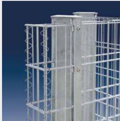
Das Anfangs- bzw. Endstück

Mit der Ecklösung und dem Anfangs- / Endstück passt sich die RANKO® Steinmauer flexibel jeder Gegebenheit an.