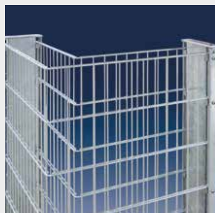
Die Ecklösung im 90° Winkel

Die Tiefe der RANKO® Steinmauer beträgt innen ca. 160 mm und außen ca. 200 mm. Dieses optimierte Maß sorgt dafür, dass im Vergleich zu herkömmlichen Gabionen deutlich weniger Steine nötig sind – so werden Kosten gespart. Stabilität erhält die Mauer durch die feuerverzinkten Doppelstabmatten vom Typ 8/6/8 sowie durch die Profilrohrpfähle mit beidseitigen Profilschienen und Aluauflageböcken, die vor der Montage einbetoniert werden. Ein „Ausbauchen“ wird durch die Montage von Schraubspannern vermieden, die als Zubehör erhältlich sind.