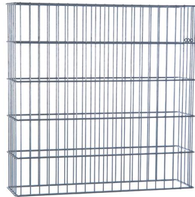
RANKO® Gabione ohne angeschweißte Pfosten