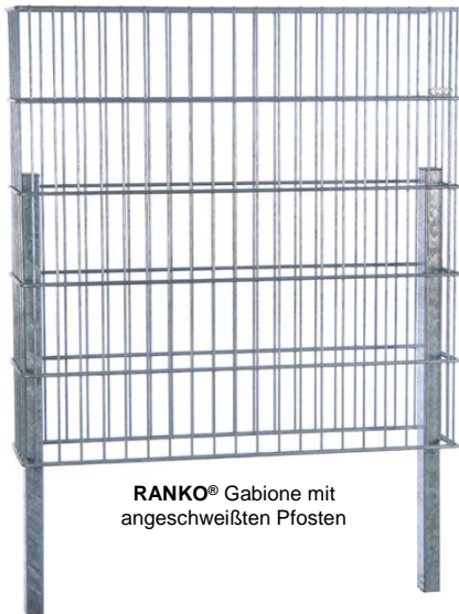
RANKO® Gabione mit angeschweißten Pfosten

Gabione Typ 2m Breite: 2010 mm Gabione Typ 2m Tiefe: 165, 262 mm