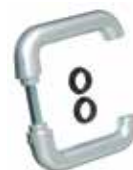
Die hochwertige Alu-Drückergarnitur passt optisch perfekt zum Basic-Tor.