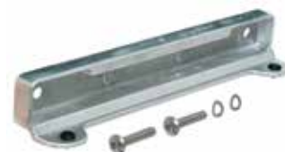
Der passgenaue Alu-Anschlag sorgt für höchste Schließgenauigkeit.