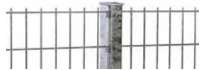
RANKO Profilschienenpfahl laut GUVV