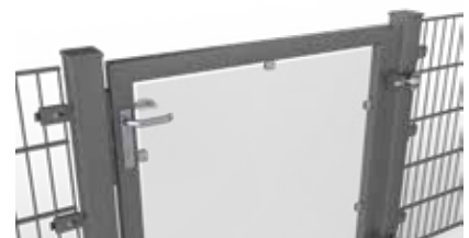
Torfüllung aus Verbundsicherheitsglas