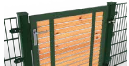
Torfüllung aus Naturholz (Sibirische Lärche)