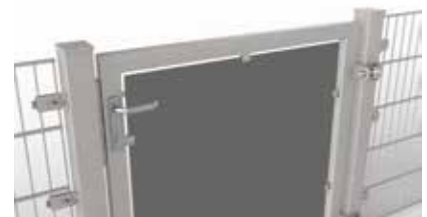
Torfüllung aus Trespa®-Platte