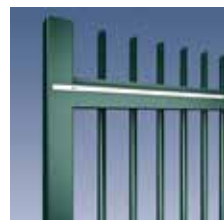
Durchgäng. Rundstab Ø 25 mm