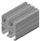
Doppelprofil HST 3/7/2 300 x 350 mm (bis 25 m)