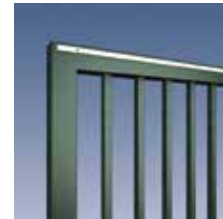
Profilstab 30 x 30 mm