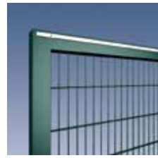
Doppelstabmatte Typ 6/5/6