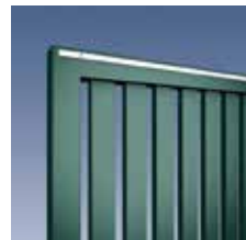
Profilstab 80 x 30 mm