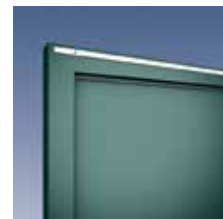
Glattblech 2 mm