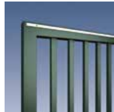
Profilstab 40 x 30 mm