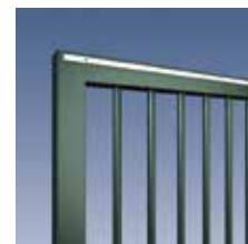
Rundstab Ø 25 mm